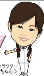
マスコットキャラクター <りんちゃん>

痛む場所を強く押ししたり、無理にストレッチすることはありません。 もちろん、ボキボキ・バキバキは一切ありません。多くの方がウトウトと眠ってしまうほど、 リラックスしてお受けいただける施術ですので、ご安心ください。